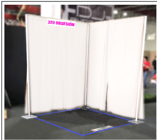
Tipo A: 2 x 2