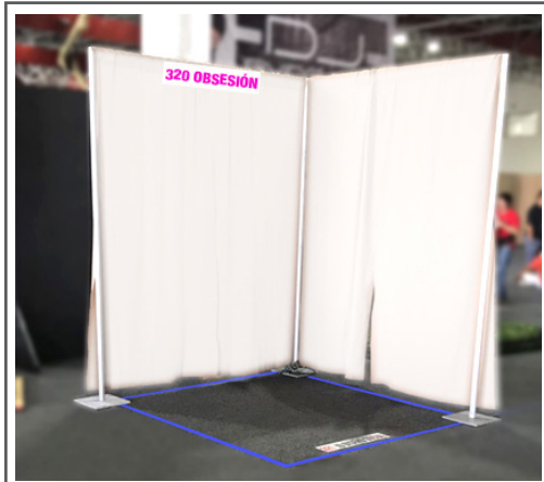
Tipo A: 2 x 2